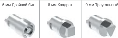
5 мм Двойной бит