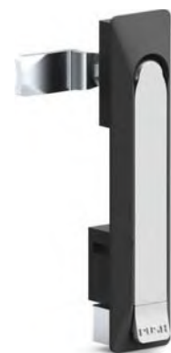
Без цилиндра '00'